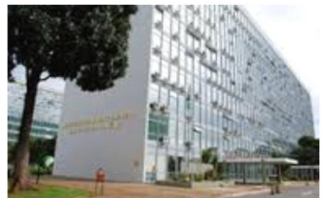
Escolas técnicas e universidades federais, hospitais e edifícios públicos