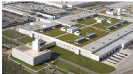
Instalações industriais e comerciais