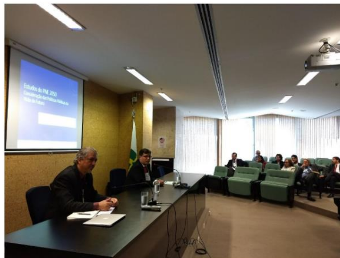
2º Workshop de Políticas Públicas para o PNE 2050

A EPE esteve presente no 2º Workshop de Políticas Públicas para o Plano Nacional de Energia 2050 no dia 3 de maio, quinta-feira, em Brasília. O evento foi coordenado pelo Ministério de Minas e Energia (MME) junto da Empresa de Pesquisa Energética (EPE). Participaram a convite do MME, instituições como Ipea, BNDES, bancos públicos, Finep, e representantes de outros ministérios, entidades e órgãos da Administração Pública ligados à área econômica.