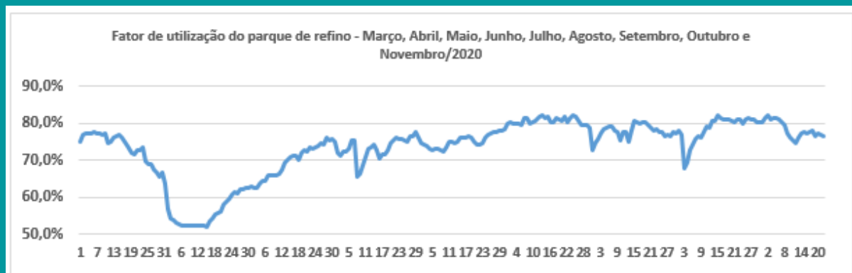
Fator de utilização global das refinarias do sistema Petrobras

Na última semana, no geral, a carga global de processamento de petróleo nas refinarias acompanhadas se apresentou estável, próxima de 77%, com ligeira queda no dia de ontem para 76,4%.