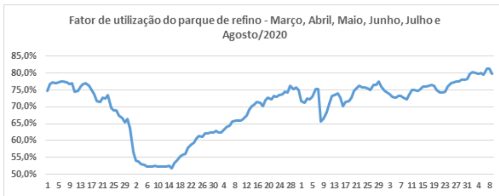
Fator de utilização global das refinarias do sistema Petrobras.