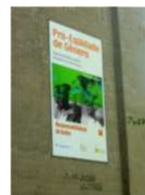
Banner sobre a Pró-Eqüidade de Gênero, de 7M, exposto em um dos Blocos da sede de FURNAS

FURNAS, a partir de 2005, iniciou o Programa Pró-Eqüidade de Gênero , lançando o projeto: Construindo um Olhar Coletivo sobre a Mulher numa Perspectiva de Gênero , com a finalidade promover a eqüidade de gênero por meio da implantação de ações dirigidas às mulheres, no que diz respeito ao reconhecimento de seu trabalho, empoderamento econômico, social, político e a melhoria da qualidade de vida, tendo como público alvo às mulheres da Empresa e das comunidades onde atua. Em 2006 a RD nº 0112351 criou o Grupo Gênero com um titular e dos suplentes de cada uma das seis diretorias da Empresa sob a coordenação da CS.P, Em 2006 foram realizados 20 reuniões do GG.