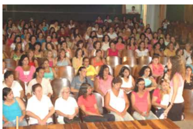
Palestra para a comunidade de São José da Barra