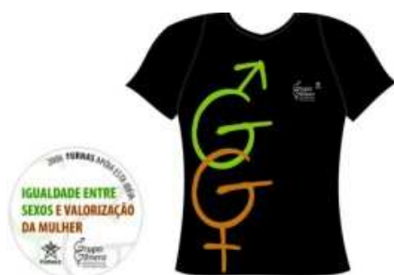
Bottom e Camiseta do Grupo Gênero