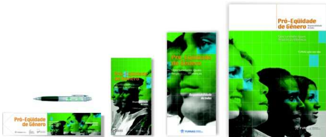
Canetas, Marcador de livro, Folders, Cartazes e Pasta com a aplicação da identidade do Programa Pró-Equidade de Gênero.