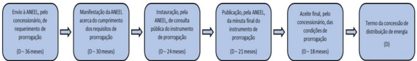
Figura 2 - Síntese do rito proposto para a prorrogação das concessões de distribuição vincendas.

promovida licitação para a escolha de um novo concessionário.