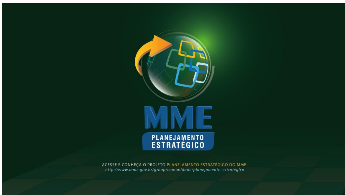
Figura 9 – Pano de fundo (wallpaper) do Planejamento Estratégico