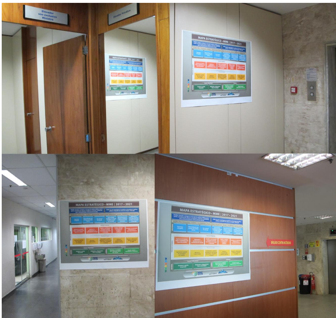
Figura 10 – Banners do Mapa Estratégico afixados no MME