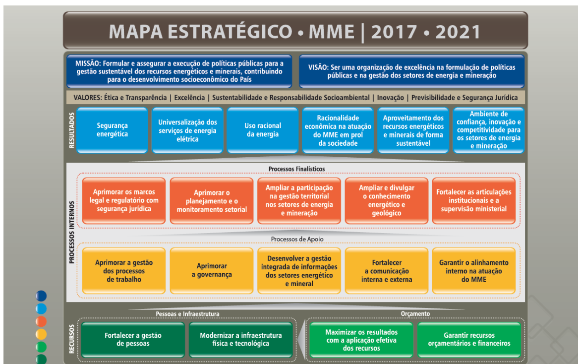
Figura 11 – Banner do Mapa Estratégico