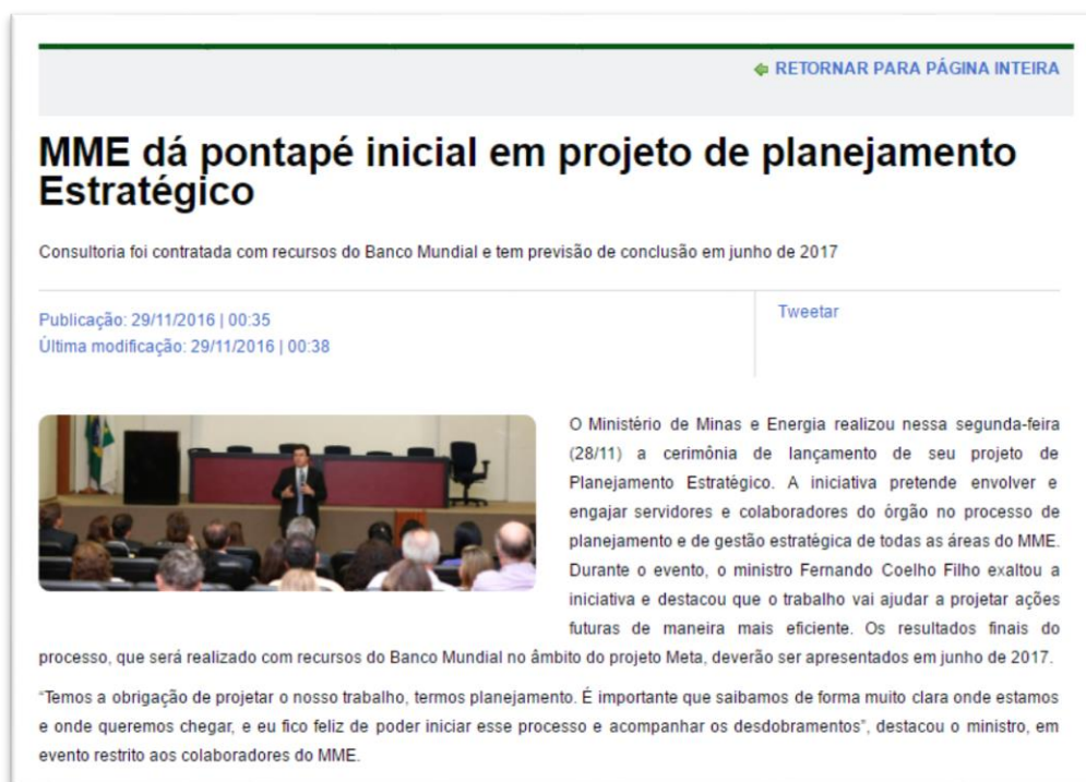
Figura 4 – Matéria de Divulgação do Evento de início do Projeto

Dessa forma, foram executadas como estratégia de comunicação do Planejamento Estratégico as seguintes ações: elaboração de mousepad com referenciais estratégicos do MME (missão, visão e valores); participação no lançamento do início do Projeto, realizado pelo Ministro de Minas e Energia no dia 28 de novembro de 2017 (figura 4); organização e preparação do evento de lançamento do Planejamento Estratégico (decoreção do espaço; elaboração de convite virtual para o evento; e-mail marketing para divulgação do evento; contratação de palestrante para o evento; buffet e recepcionistas para o evento).