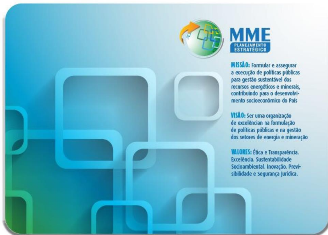
Figura 5 – Mousepad com a divulgação dos referenciais estratégicos do MME: missão, visão e valores