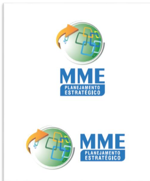
Figura 8 – Logos criadas para o projeto