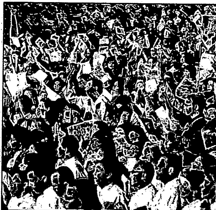
Momento de louvor durante a celebração: fiéis, em coro, entoam cânticos

Assessoria de Comunicação Ministério de Minas e Energia (61) 2032 5620/5588